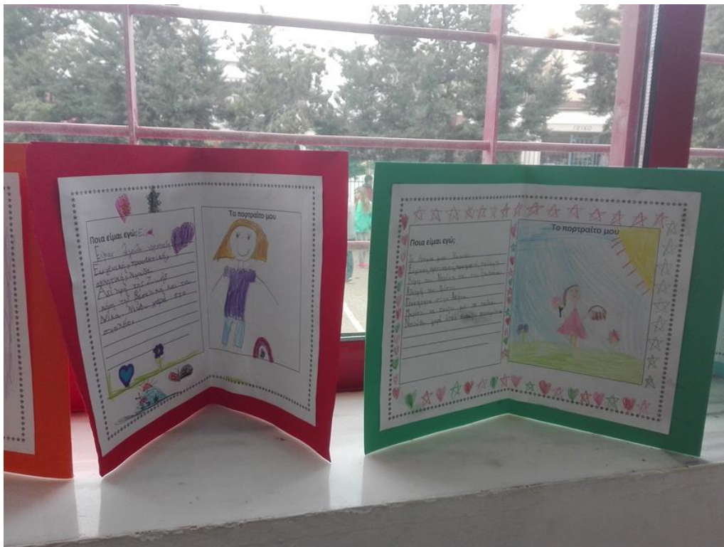
Το πορτραίτο μου

της, τους σέβεται και τους τηρεί. Με πρώτη δράση το Τι Νέα να φέρνει τα παιδιά πιο κοντά και να τα βοηθάει να γνωριστούν καλύτερα, να εκφράζονται και οι πιο ντροπαλοί και να αναδεικνύονται ιδιαίτερες κλίσεις και ικανότητες, με τη συζήτηση των παιδιών με συντονιστή, φύλακα λόγου και χρόνου, όλα ξεκίνησαν θετικά για την έκφραση, την επικοινωνία, τη συνεργασία και την κριτική σκέψη των παιδιών που αποτελούν και τους στόχους μας.